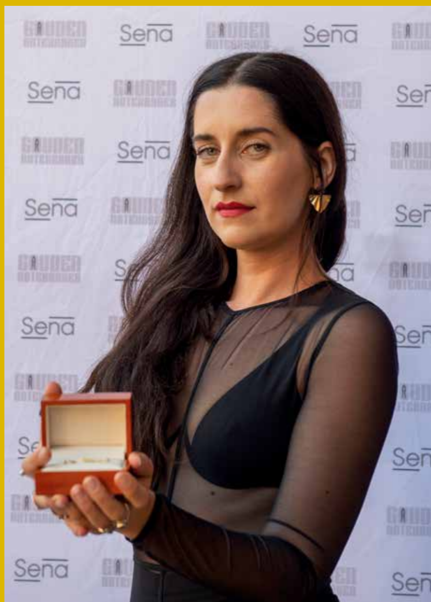
De winnaar van de Gouden Notekraker Eefje de Visser

EEFJE DE VISSER is de winnares van de Gouden Notekraker 2020, de prijs die na voordracht en verkiezing door collega's in Paradiso wordt uitgereikt aan de artiest/band met de meest bijzondere en invloedrijke live prestaties van het afgelopen seizoen. Bij Sena aangesloten muzikanten kenden de Zilveren Notekraker toe aan de band DARLYN. De Humble Hero Award werd uitgereikt aan een toonzettende en invloedrijke sessiemuzikant: violiste Marieke de Bruijn van Dutch String Collective.