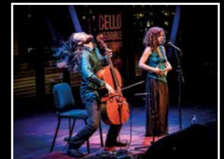
The visit