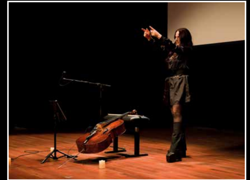
Maya Beiser bedankt het publiek

bewijzen dat de cello een zeer veelzijdig instrument is dat zowel het oudere, doorgewinterde publiek als jonge nieuwsgierige luisteraars trekt. Het instrument en z'n bespelers hebben een gouden toekomst net als de Biënnale zelf.