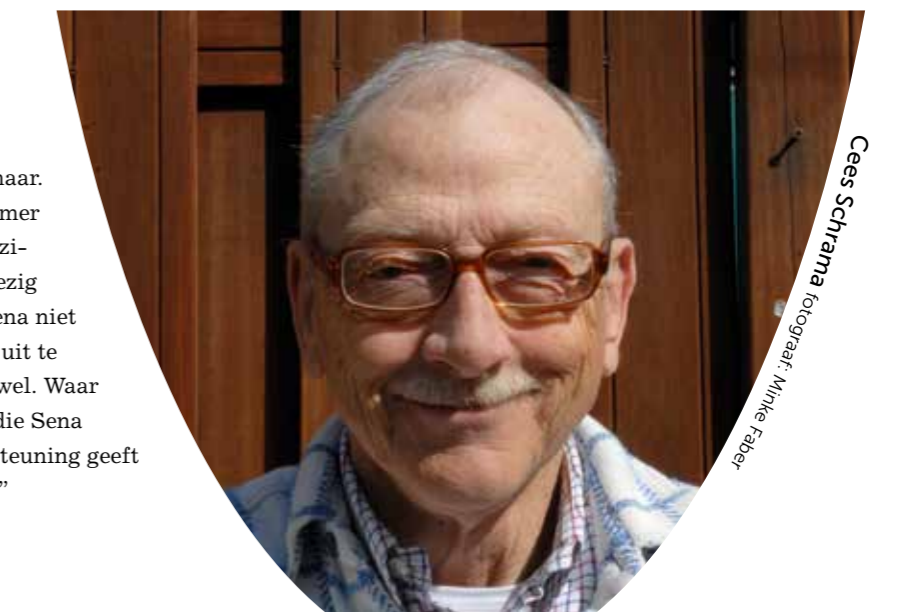
Cees Schrama