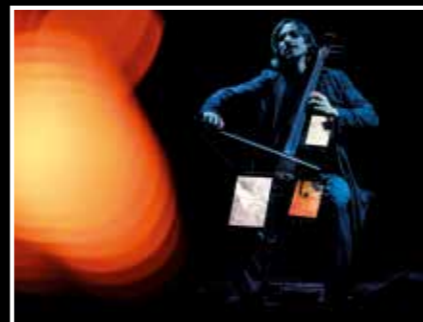
Ecce Cello